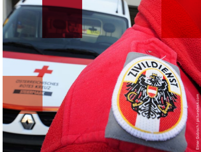
Elmar Gubisch / picturedesk.com